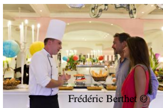
Frédéric Berthet ©

Le Club Med recrute des personnes diplômées et ayant de l'expérience dans leur métier. À ce prérequis, s'ajoute la maîtrise de l'anglais, indispensable dans le contexte d'internationalisation de l'entreprise pour tous les métiers en lien avec la clientèle. La connaissance du français et d'autres langues étrangères (italien, portugais, turc, allemand, néerlandais, russe, hébreu,...) est également un véritable atout lors du recrutement. Au-delà des compétences, le savoir-être des G.O® est un incontournable au Club Med.